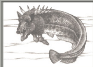
ILLUSTRAZIONI DI MAURIZIO QUARELLO ANIMATE DA LUGIA GIOVANNANGELO